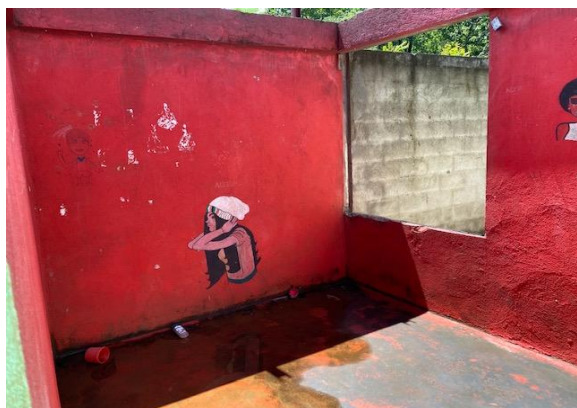
AREA DE DORMITORIO Y