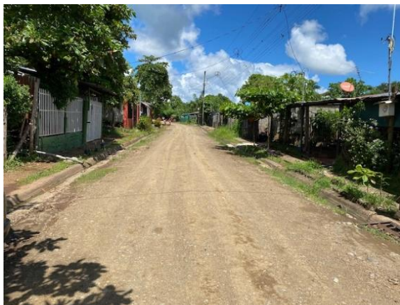
CALLE DE ACCESO