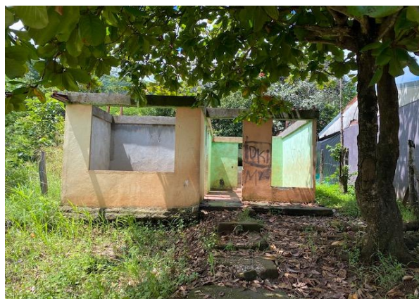
FRENTE A CALLE